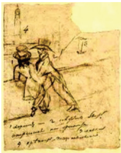
Рис. 2. А. Пушкин. Автопортрет с Онегиным на набережной Невы

О влиянии музыки на внутренний эмоциональный мир человека задумывались еще в глубокой древности; об этом говорят мифы об