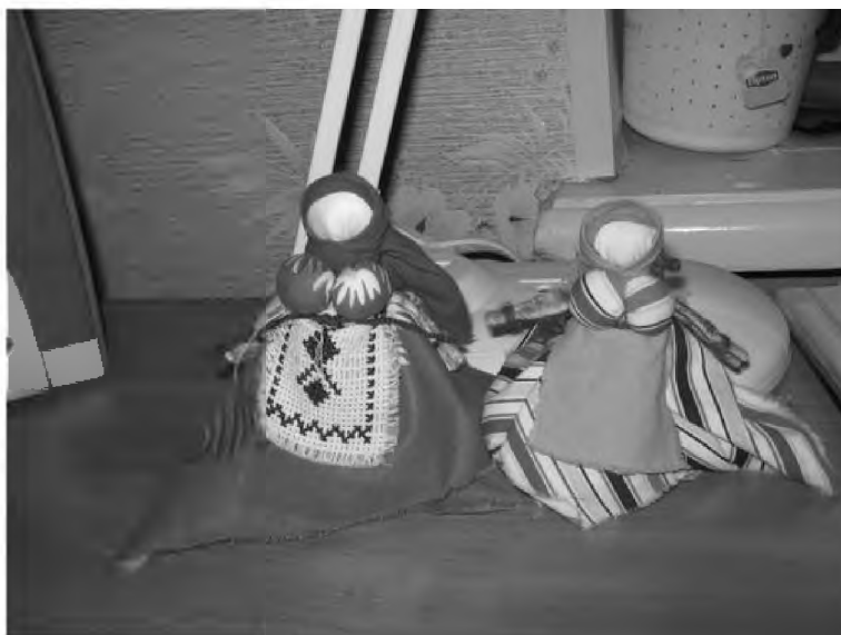
Рис. 2. Куклы-капустки рассматриваются как отражение личности рукодельницы

А это куклы-кормилки, когда такую кормилку делаешь, как бы прорабатываешь в себе женственность. Розовенькая у меня первая была - видно, что девочка совсем. Красная - типичная молодуха (замужняя женщина 1 год после свадьбы). Третья уже типичная баба (как-нить выложу фото). Расту, в общем (Larica, участница интернет-форума сайта «Mama.tomsk.ru» Larica, 07.07.2010 // http://mama.tomsk.ru ) (см. Рис. 2).