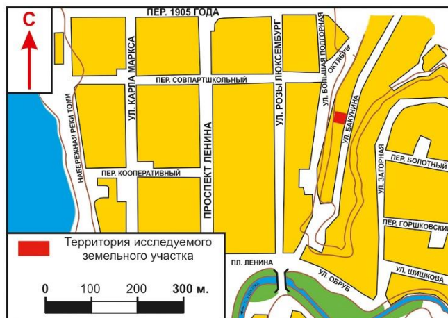
Рис. 1. Ситуационный план с обозначением раскопа 2017 г.

ский диапазон культурного слоя, мощность которого доходила до 3,5 м, широкий – с XVII по XX в. Выявлены остатки разновременных объектов, не составлявших единого комплекса.