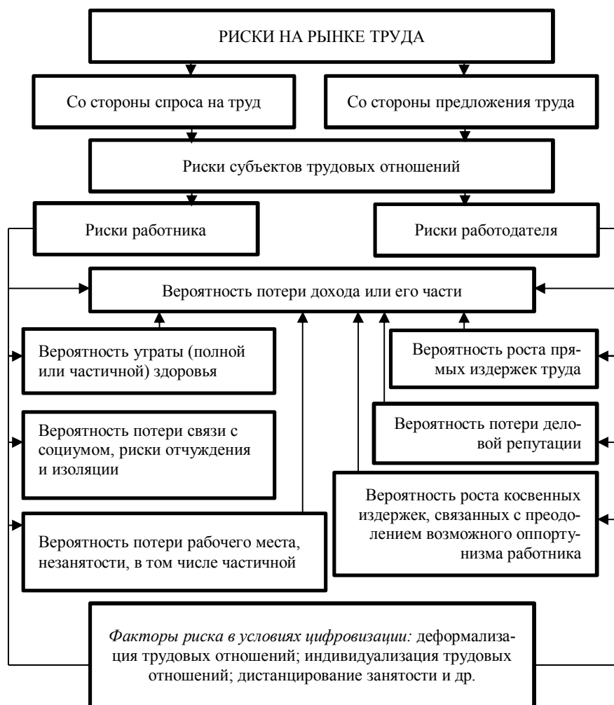
Рис. 1. Систематизация рисков на рынке труда в условиях цифровизации.

На схеме показаны основные виды рисков субъектов трудовых отношений, а также факторы, их провоцирующие в условиях цифровизации (рис. 1).