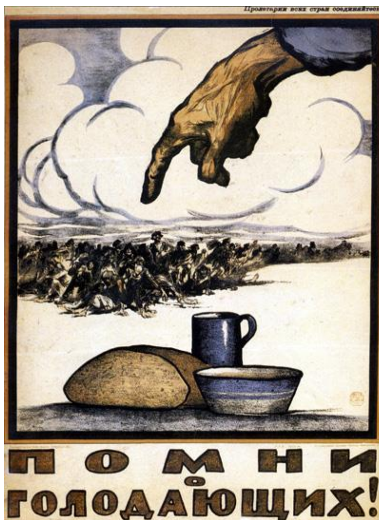
Рис. 2. Плакат «Помни о голодающих!» (И.В. Симаков, 1921 г.)

Стонет Поволжье, о хлебе моля. В дни вот этой недели Помоги Поволжью обсеменить поля, Помоги Поволжью, чтоб голодные ели [6].