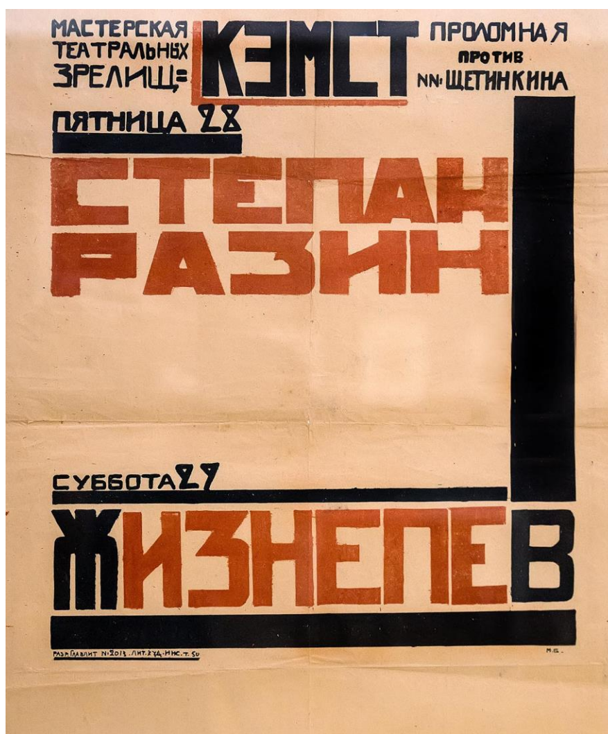
Рис. 3. Афиша постановки «Степан Разин» театра КЭМСТ, 1923 г.

В то же время расходы населения на культурный досуг (экскурсии, музеи, книги, покупку музыкального инструмента) были скудными: в первую очередь приходилось рассчитывать средства на оплату жилья, продукты, предметы первой необходимости. К примеру, в 1927 г. в Марийской автономной области цена за литр керосина составляла 13 коп., за килограмм рафинада – 78 коп., а плата за прокат коньков или услуги лыжной базы – 30 коп. в час для простых граждан и 50 коп. в день для членов профсоюза. [16. 1927. № 68]. А если учесть, что интенсивный труд рабочего составлял 6 дней в неделю более 11 часов, то к выбору досуга подходили прагматично и в столичных городах, и в провинции.