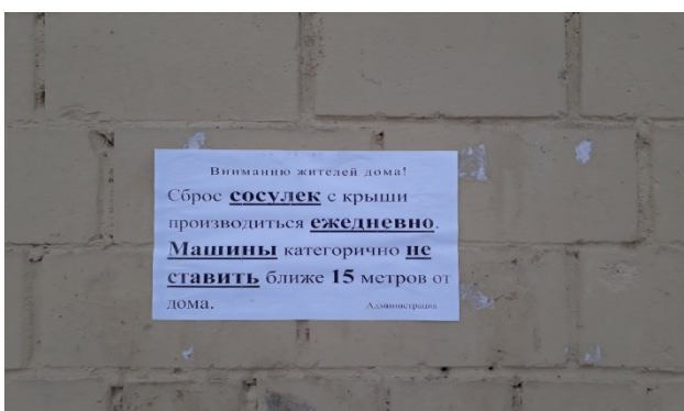
Рис. 4. Внимание жителей дома! Сброс сосулек с крыши производится ежедневно . Машины категорично не ставить ближе 15 метров от дома. Администрация

5. Речевые оплошности как стилистический прием. Интернет-мемы. Косвенным свидетельством того, что в интернет-коммуникации у речевых оплошностей формируется свой особый статус, является их способность становиться интернет-мемами, т.е. самостоятельно функционировать, устойчиво воспроизводиться как стилистический прием в текстах разных жанров. Некоторые воспроизводятся в течение длительного времени, что несвойственно быстро появляющимся и быстро устаревающим мемам. Стабильное употребление оплошностей в течение длительного времени (2–5 и более лет) позволяет считать, что они обнаруживают тенденцию к лексикализации. Таким образом, может выстраиваться цепочка: речевая оплошность => интернет-мем => окказионализм