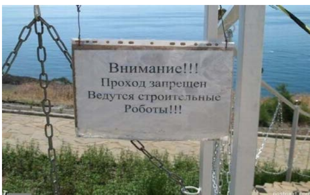
Рис. 2. «Внимание!!! Проход запрещен Ведутся строительные Роботы!!!»