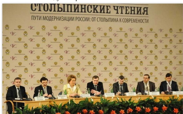
Рис. 3. СТОЛЫПИНСКИЕ ЧТЕНИЯ Пути модернизации России: от Столыпина к современности