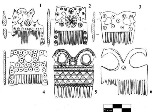
Рис. 2. Фрагменты гребней: 1 – Томск (XVII в.); 2–4 – Мангазее (XVII в.); 5 – Суздальское Ополе (IX–X в.); 6 – Вщиж (IX–X в.)

Аналоги в Архангельской губернии [12. С. 50], на городищах Псковском [13. С. 306], Камно, Сарском, в Старой Ладоге, в курганах Суздальского Ополя [14. С. 104], в Мангазее [6. С. 277] и др. (рис. 2).