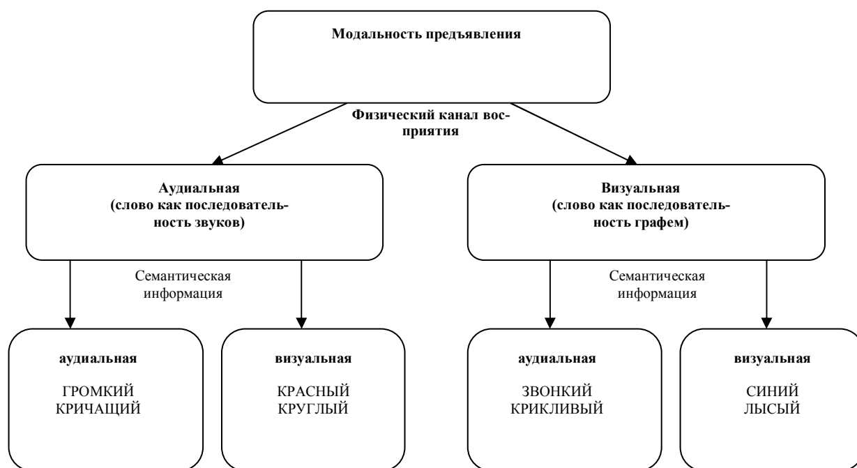
Рис. 1. Связь физической и семантической модальностей

– физическая модальность , посредством которой в актуальный момент времени (например, при проведении эксперимента) происходит репрезентация и восприятие информации (тот канал восприятия, через который респонденты получают информацию, например аудиальный (через наушники) vs визуальный (на экране монитора)). Обусловлено это тем, что означаемое языкового знака существует в двух формах. Само слово воспринимается как образ звучания – последовательности звуков – или визуальный образ – последовательность графических единиц.