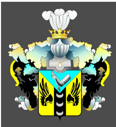
Рис. 1. Герб рода мурз Кульмаматьевых.

После смерти Авазбакея в 1777 г. специальным предписанием сибирского губернатора Д.И. Чичерина Сабанак был определён на место отца. Позже, 27 июня 1779 г., по представлению светлейшего князя Г.А. Потёмкина он был произведен в татарскую команду головой 1-го класса, а его брат Исмагулла – головой 2-го класса (Тычинских 2010: 121). Высочайшею грамотой Екатерины II 25 апреля 1796 г. Сабанак был возведен в дворянское достоинство «с рожденными и впредь рождаемыми детьми и потомством их по нисходящей линии» (РГИА. Ф. 1286. Оп. 2. Д. 347. Л. 17 об.). С этого момента к имени Сабанака Кульмаматьева и его потомков прибавлялся титул мурза и был учреждён их родовой герб (Гербовед 2003: 434).