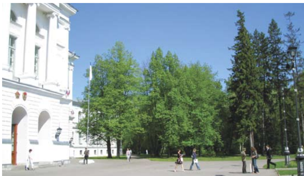
Липы и ели, посаженные П.Н. Крыловым перед главным зданием университета. Фото И. Гуреевой, 2005