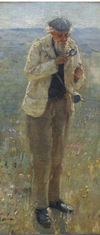
В.Е. Маковский. Портрет П.Н. Крылова. Гербарий ТГУ

Порфирий Крылов окончил фармацевтические курсы при Императорском Казанском университете и, работая университетским садовником, увлекся ботаникой. В 1885 году по приглашению В.М. Флоринского он приехал в Томск и занял должность ученого садовника, став первым штатным сотрудником Томского университета.