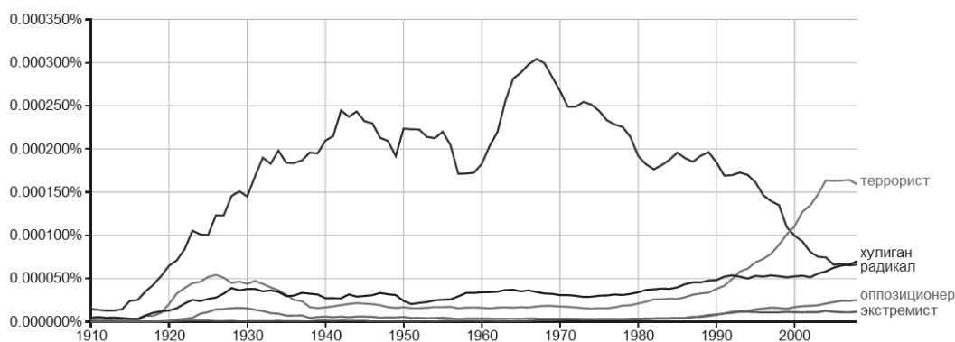
Рис. 2. Сравнительная употребляемость понятия «экстремист» в русскоязычных текстах за последние сто лет по данным сервиса Google Books Ngram Viewer

Graph these comma-separated phrases: case-insensitive between and from the corpus with smoothing of .