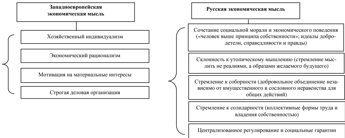
Рис. 2. Особенности формирования представлений о модели экономического человека до начала XX в.

благам и окончательной целью хозяйственной деятельности; 2) производство не должно осуществляться за счёт ущемления достоинства других производителей. Никто (ни человек, ни природа) не может быть орудием экономического производства или эксплуатации. Каждый человек должен быть обеспечен материальными средствами, достаточными для достойного существования и развития. Трудовая деятельность в отношении к природе должна рассматриваться с точки зрения оживления в ней мёртвого, одухотворения вещественного, а не просто как процесс добычи вещей и денег.