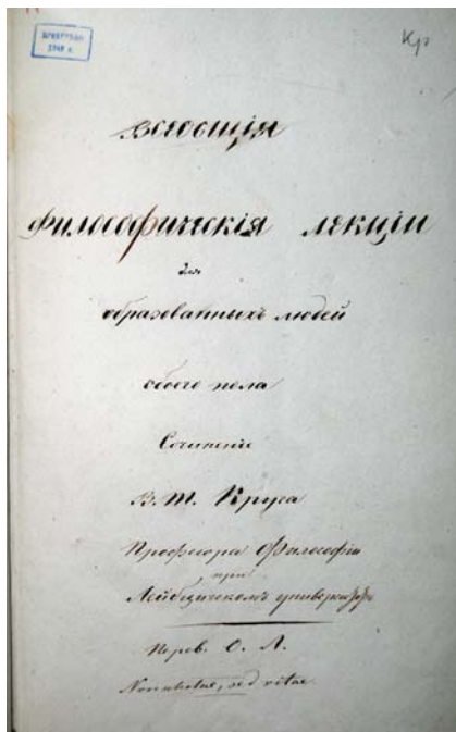
ОРКП НБ ТГУ. 47.687. Круг, Вильгельм Траугот. «Всеобщие философические лекции для образованных людей обоего пола. Сочинение В.Т. Круга, профессора философии при Лейпцигском университете. Перев. О.Л. Non scholae, sed vitae». XIX в. (30-е гг.). 213 л.

Три рукописи посвящены проблемам философии и логики. Это «Логика чистая и прикладная» И.Е. Шада [16], «Нравственная философия» [17] и «Всеобщие философические лекции для образованных людей обоего пола» В.Т. Круга [18].