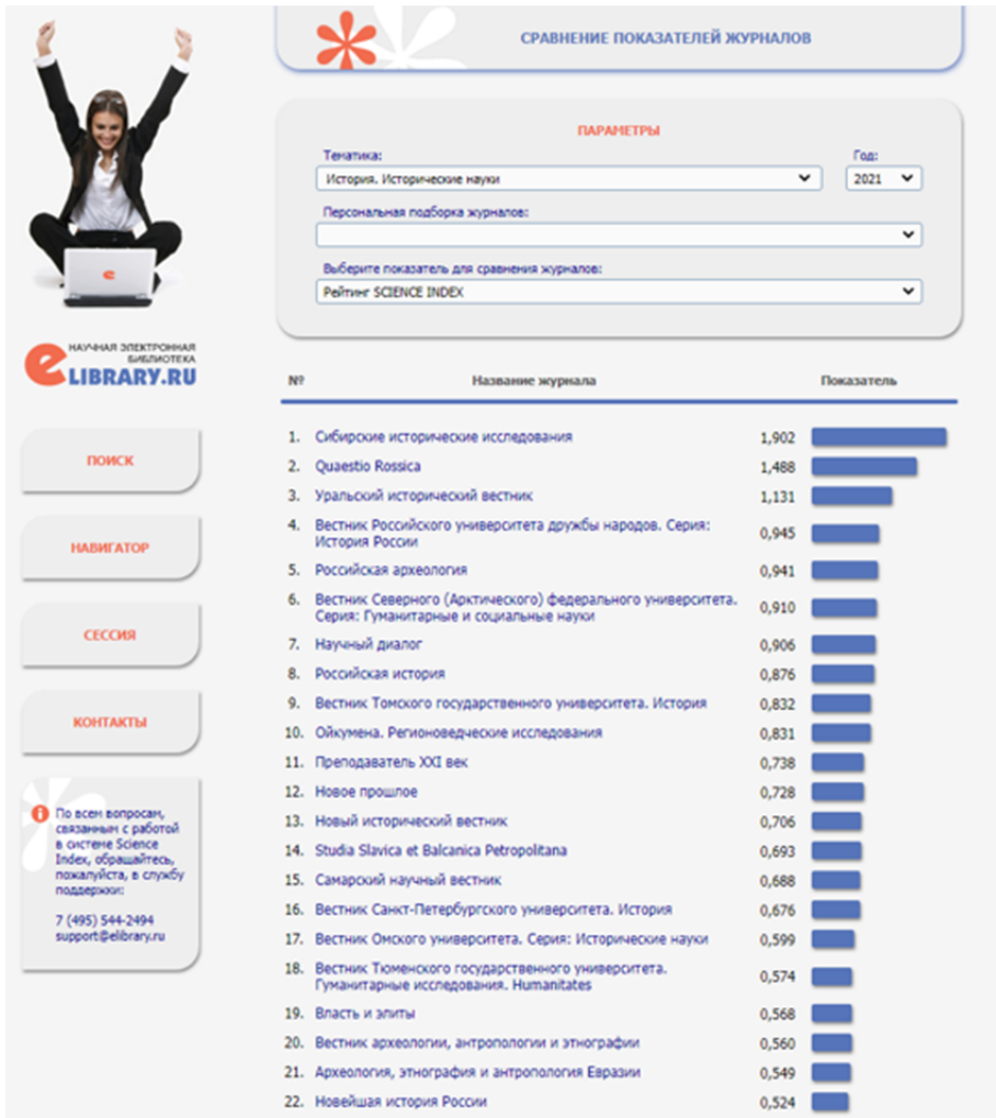
Рис. 2. Рейтинг Science Index 2021 г. по категории «История. Исторические науки». Источник: www.elibrary.ru/titles_compare.asp (дата обращения: 08.02.2023)

Надеюсь, в этом году мы также сможем сохранить свой академический уровень. Ориентиром при отборе публикуемых материалов, как и ранее, остается высокое качество текстов в области социокультурной антропологии и смежных областях, теоретическая насыщенность, вписанность в современные антропологические дискурсы, новизна как материалов, так и подходов к их анализу. Журнал открыт для новых ярких работ, построенных на сравнительном анализе максимально широких по географическому охвату материалов.