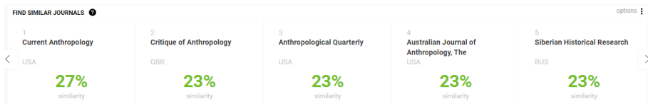
Fig. 1. The degree of proximity of anthropological journals (www.scimagojr.com)

What does IEA RAS have to do with it? The fact that our journal, despite its specific name, positions itself and is known among specialists precisely as an anthropological journal. And since this is the case, then it should be compared precisely with the leading institutions in this field of knowledge and the journals published by them. The journal Ethnographic Review , published by the IEA RAS, is one of those samples we have oriented ourselves to. In this regard, it will be interesting to look at how the largest rating agency Scimago determines the degree of proximity of anthropological journals (see Fig. 1). If we take Ethnographic Review as a starting point, then Current Anthropology (27%), Critique of Anthropology , Anthropological Quarterly , The Australian Journal of Anthropology and Siberian Historical Studies (all four at the level of 23%) will be in the top five closest to it according to Scimago. Pretty good neighbors, in my opinion.