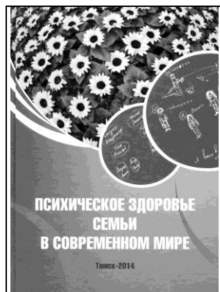
Сборник II Российской конференции с международным участием «Психическое здоровье семьи в современном мире» (2014)

В 2014 г. главными направлениями II Российской конференции с международным участием «Психическое здоровье семьи в современном мире» стали вопросы трансформации семьи, психологических и психиатрических проблем общества, междисциплинарных исследований основных клинико-динамических, социально-психологических, адаптационных и других факторов при болезнях зависимости и психических расстройствах у лиц разного возраста [6, 16].