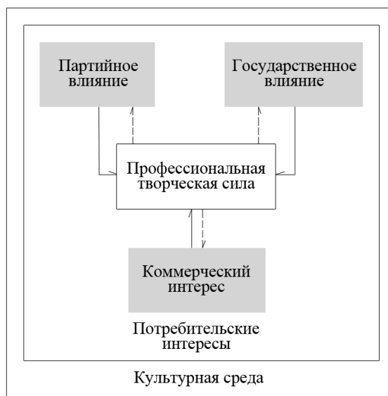
Рис. 2. Китайская структура взаимодействия акторов в процессе медиапроизводства [2]

Однако после 2007 г. под давлением провинциальных органов власти Пекин все же согласился на перераспределение рынков «в ручном режиме», фактически передав функции национального регулятора в регионе государственной корпорации SMC [6]. Если говорить о динамике развития ситуации в провинции Гуандун и её итогового разрешения, то мы можем увидеть, что партийный и государственный векторы являются фактически дублирующими друг друга. Этот факт вносит некритичное противоречие в введенную институтом Цинхуа модель. Более того, в случае выделения «партийного контроля» из контроля государственного резко встаёт вопрос о его пассивности в одном случае и непоследовательности в иных.