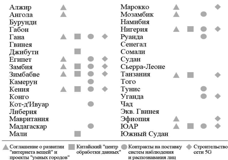
Рис. 3. Африканские страны – подписанты стратегического Меморандума о взаимопонимании и сотрудничестве по созданию телекоммуникационного коридора Азия–Европа в рамках программы «Цифровой Шёлковый путь» и степень вовлеченности китайских госкорпорации в развитие телекоммуникационной сети стран (Источник: Australian Strategic Policy Institute. URL: https://chinatechmap.aspi.org.au/ )

интеграционные проекты КНР в развивающихся странах Африки и Азии стали неотъемлемой структурной частью китайской внешней политики. В условиях ограничений на рынках развитых стран, пока лишь в сфере электронной продукции и программного обеспечения, а также перспективы потери индийского рынка (из-за обострившихся трений на границе) КНР заинтересована в создании стабильной экспортной зоны для своей продукции. Такие проекты, как «Цифровой Шёлковый путь», параллельно с экономическими выгодами привносят используемые в Китае коммуникационные шаблоны и стандарты, что фактически фиксирует развивающиеся государства в их ориентации на китайские рынки [13]. В сфере законодательного регулирования встречаются прецеденты, когда экономическое влияние КНР приводит к формированию целых областей законодательства в государствах-партнёрах по проекту, фактически дублирующих аналогичные законодательные акты КНР. Так это произошло, например, в имеющей широкие экономические связи с КНР Танзании, обсуждается возможность применения подобных практик в Уганде и Кубе [14].