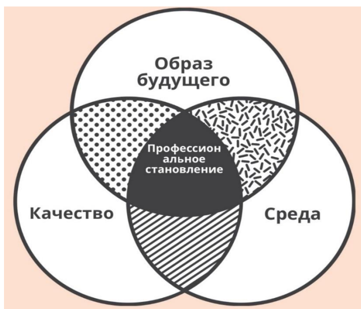
Рис. 1. Компоненты ценностно-аксиологического аспекта интернационализации

Рассматривая интернационализацию в рамках ценностно-аксиологического направления, определим важность личностных смыслов и обоснования системы ценностей индивида в качестве предикторов межкультурного диалога, позитивного межэтнического взаимодействия. Найти себя в том, что не обозначено личностными смыслами, невозможно. В основе формирования личностных смыслов в контексте интернационализации лежат когнитивные априорные установки, предварительные представления о цели деятельности (образ будущего), должном (качество), желаемом и допустимом (среда) (рис. 1). Эти компоненты, в сущности, характеризуют основы профессионализации студента и находятся в центре внимания и дискуссий [23. С. 165].