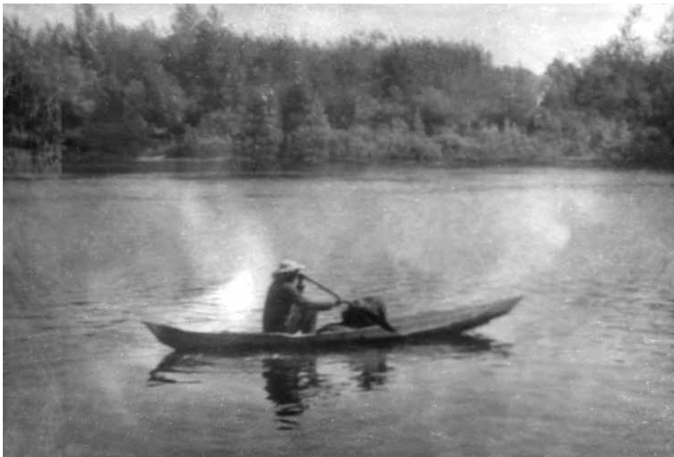
Фото 4. На обласке по Васюгану. 1968 г.

Итоговые результаты стажировки не только внушали персональный оптимизм, но открывали новые перспективы для развития археологиче-