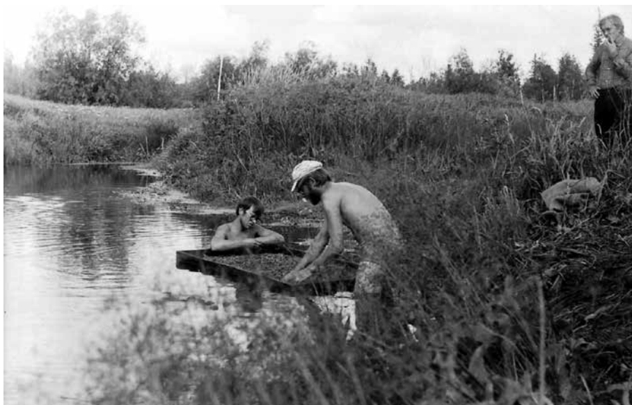
Фото 8. Тух-Эмтор, 1974 г.