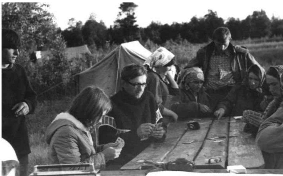
Фото 7. Карточный турнир. Малгет, 1975 г.

ходимыми. Шли два дня с ночевкой в охотничьей избушке. К счастью, было тепло и гнус еще не поднялся. На подходе к конечной цели путешествия столкнулись с редким в этих местах оптическим явлением, чем-то вроде миража. Это настолько смутило проводников, что они перепутали ориентиры. С двумя хантами заблудиться в лесу невозможно, но поплутать пришлось, что окончательно измотало и без того уставших путников. Через 3 года экспедиционная судьба провела меня по этому маршруту, и это было одним из тяжелейших испытаний в моей жизни.