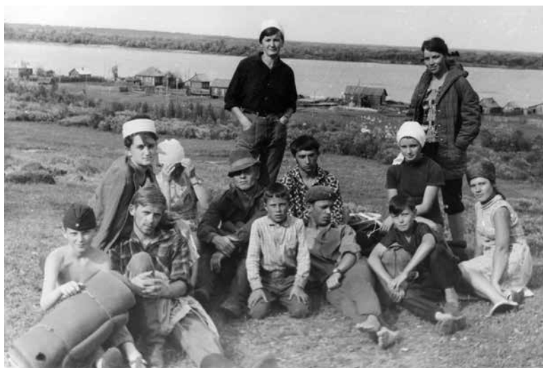
Фото 2. На память о Молчаново. 1966 г.

чертить планы, отвечать за работу бригады. Так, исподволь, без специальных тренингов и занятий накапливался необходимый опыт, нарабатывались профессиональные навыки и умения.