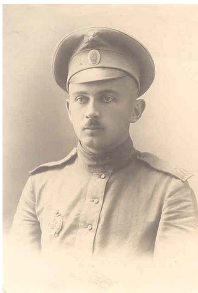
Фото 1. Е.А. Береговой в период службы в 726-й пехей Пензенской дружине государственного ополчения. [Владивосток]. 1916 г.

Но жизнь юноши призывного возраста изменила обстановка Первой мировой войны. Путь Евгения в офицеры примечателен. С 1 июля 1916 г. наш герой был призван на военную службу в 726-ю пешую Пензенскую дружину государственного ополчения, расквартированную во Владивостоке (фото 1).