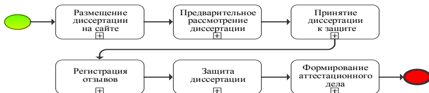
Рисунок 1 – Модель процесса аттестации кадров высшей квалификации в нотации BPMN 2.0

В ТГУ обеспечение качества аттестационных документов, контроль соблюдения нормативных актов осуществляет отдел диссертационных советов (ОДС). Для определения основных работ отдела проведён анализ перечня основных видов работ документоведа ОДС ТГУ и баланс рабочего времени.