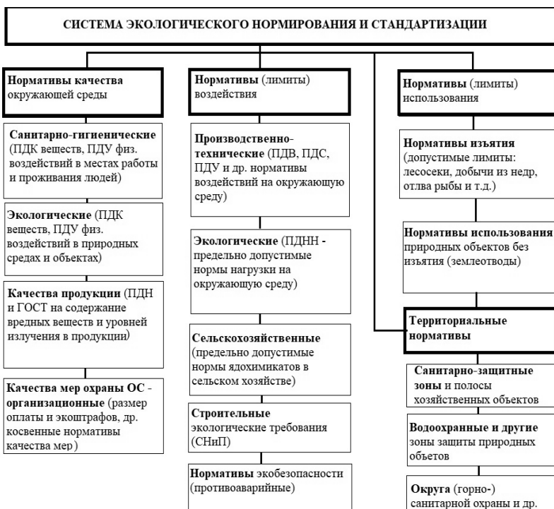
Рис. 1-1. Система экологических нормативов и стандартов (Макаров, 2013)

ПДТН – предельно допустимая техногенная нагрузка, предельно допустимая экологическая нагрузка; величина максимального нарушения естественной среды территории в результате изъятия природных ресурсов и загрязнения среды, не выходящая за пределы экологической техноёмкости территории.