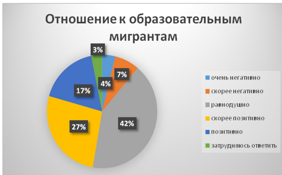
Рис. 2. Отношение к образовательным мигрантам

Общее отношение к образовательным мигрантам, как уже отмечалось выше, существенно лучше, чем к трудовым. Позиция «равнодушно» в отношении образовательных мигрантов также лидирует (42%), но на втором и третьем местах находятся варианты, демонстрирующие позитивное отношение («скорее позитивно» – 27% и «позитивно» 17% опрошенных), что в сумме делает позитивное отношение преобладающим (44%). Негативное отношение проявляют 11% (рис. 2).