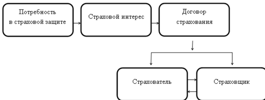
Рис. 1. Формирование страховых отношений

Собственно в замкнутой раскладке возможного ущерба между участниками договора и состоит сущность страхования. Она раскрывается с помощью определенных функций. При этом исходной базовой является рисковая, означающая предупреждение или минимизацию страховых рисков [2]. Механизм страхования можно представить схематически (рис. 1).