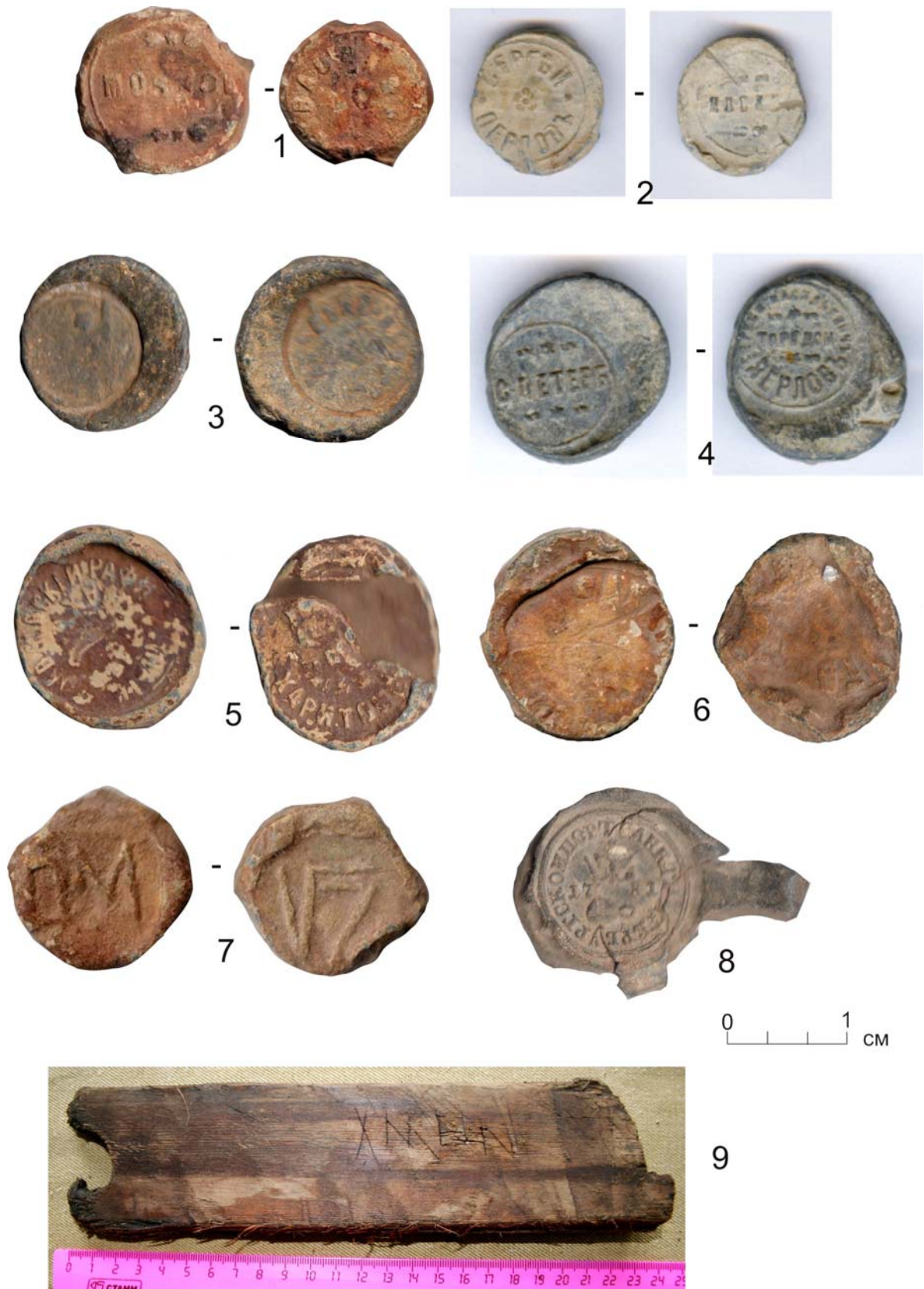
Рис. 2. Торговые пломбы: 1–4 – пломбы торгового дома С. Перлова; 5–6 – пломбы торгового дома Харитонов; 7 – пломба магазина № 7 «Ткани»; 8 – пломба Санкт-Петербургской компании 1781 г.; 9 – деревянная дощечка-пломба. 1, 5, 8, 9 – археологические материалы г. Тары 2012–2014 гг. 2, 4 – по [9]; 3, 6–7 – из коллекций Тарского краеведческого музея