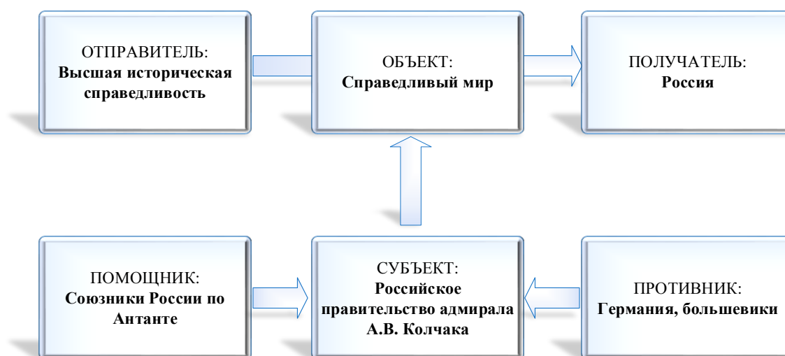
Рис. 1. Структура нарратива о «Великой войне»

Репрезентация рассказов о « Великой войне » и « Единой Неделимой Руси » происходила в результате соединения и комбинирования нескольких дискурсов, рассматриваемых как отдельные потоки социальной коммуникации. При этом политический дискурс задавал идеологические ценности и установки значимые для понимания настоящего, а масс-медийный дискурс выступал как форма актуализации и представления информации с целью воздействия на аудиторию.