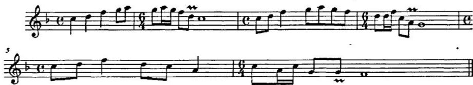
«Мальчик и мужичок»

По размеру уцинь может быть как объёмным, так и коротким произведением. Пение здесь является основной формой исполнения, а речитатив – вспомогательной. Уцинь базируется на языковой основе и имеет стабильный ритм и плавную мелодию. У дауров присутствуют свои собственные эстетические симпатии: из песен уцинь почти все басовые тоны и длинные тоны значительно вибрируют. Возникающее в результате “плачущее” чувство является яркой этнической характеристикой и значительным национальным акцентом песенного творчества дауров.