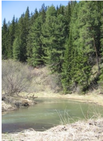
Рисунок – 3 – Ларинский заказник [4]

Стоит отметить, что Ларинским заказником заинтересованы не только экологи и администрация Томской области, но и французские специалисты. Осенью 2012 г. они проводили оценку туристических возможностей Томского района, в том числе Ларинского заказника. Экспертов впечатлили его живописные ландшафты, уникальный Звездный ключ с травертиновыми образованиями, речка Тугояковка с самой чистой в области водой, где водится хариус. Животный мир заказника с краснокнижными алтайским сурком, косулей, бородатой неясытью и растительный мир, включающий 26 видов растений, занесенных в Красную книгу, по их мнению, добавляют экскурсионной привлекательности памятнику природы.