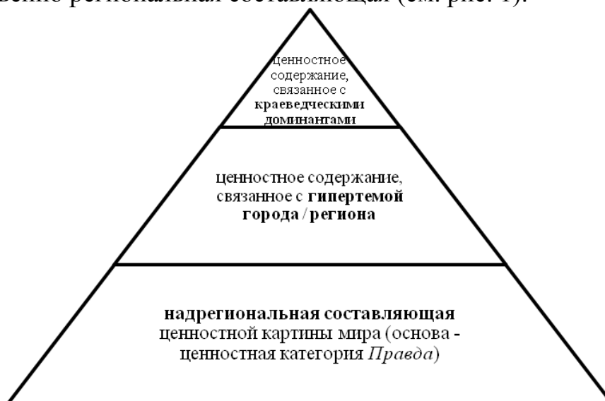
Рис. 1. Аксиосфера регионального медиадискурса

Для исследования аксиологической составляющей медиатекстов в регулятивном аспекте представляется целесообразным обращение к понятию АСК. При этом следует учитывать, что в аксиосфере регионального медиадискурса наряду с надрегиональной составляющей, которой посвящена вторая глава диссертационного исследования, несомненную значимость обретает собственно региональная составляющая (см. рис. 1).