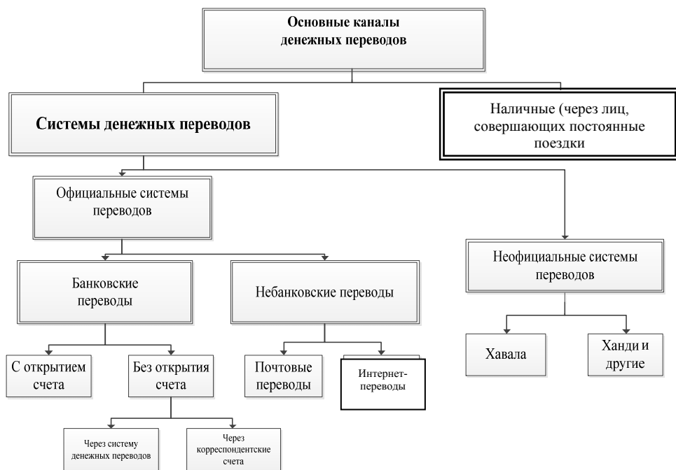
Рис. 2. Каналы денежных переводов трудовых мигрантов

На рис. 2 представлены основные каналы денежных переводов.