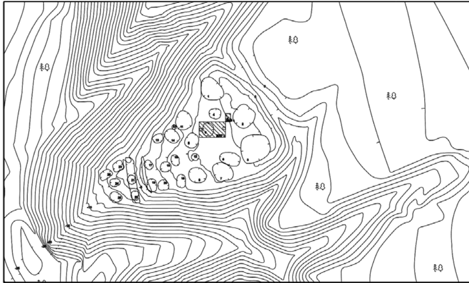
Рис. 2. Топографический план городища Шайтан III

строек наличие очагов-печей, или чужалов, является характерной особенностью. К сожалению, сильная фрагментарность не позволяет восстановить их детали [5. С. 37].