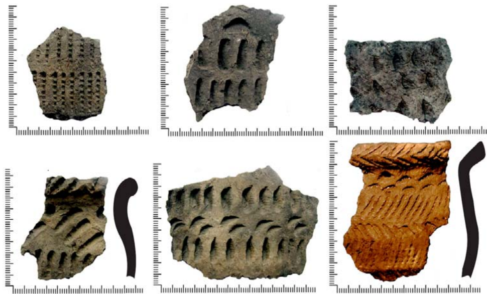
Рис. 3. Керамика с постройки городища Шайтан III

Важное значение имеют особенности несущей конструкции постройки. В южном углу удалось зафиксировать угловое сочленение двух обгоревших бревен, являющихся остатками стены. Бревна диаметром 0,14–0,22 м, на одном из которых заметны четкие следы врубки, были уложены в «чашку», что свидетельствует о применении срубной технологии.