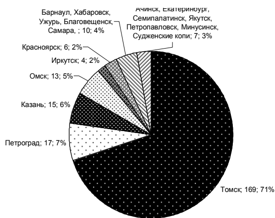
Рис. 1. Общий состав участников съезда