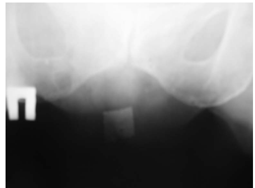
Рис. 1. Обзорная рентгенограмма малого таза через 6 лет после операции (2006 год)

Выводы. Использование данного способа укрепления формируемой влагалищной перегородки при срединной кольпоррафии позволяет устранить не только косметический дефект, но и нормализовать функцию мочевого пузыря и прямой кишки, повышает качество жизни пациенток. Сама технология выполнения операции не исключает возможность ее модернизации.