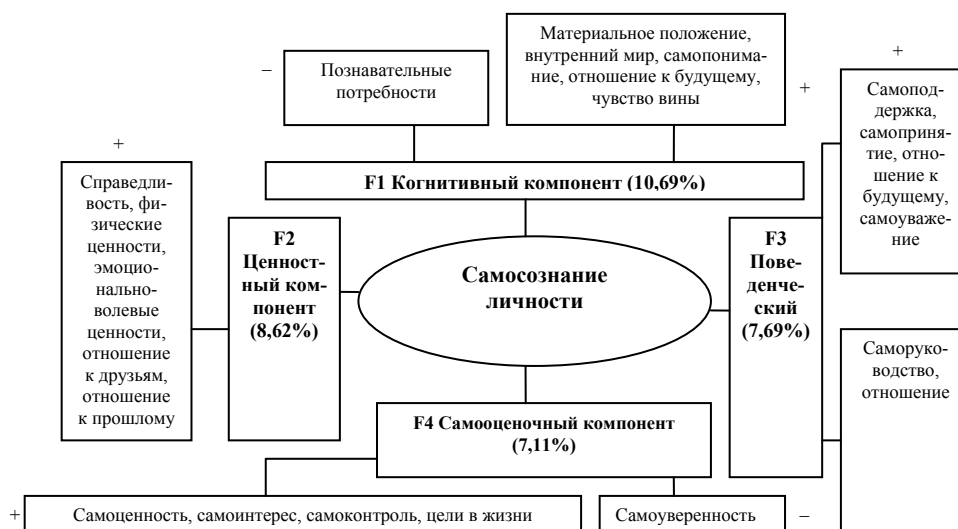
Рис. 2. Структурно-содержательные компоненты самосознания лиц юношеского возраста (выборка «группа риска»)

самоконтроль (0,435), цели в жизни (0,576), самооценку (0,563), самоинтерес (0,463), отрицательный полюс фактора представлен признаком самоуверенность (-0,436).