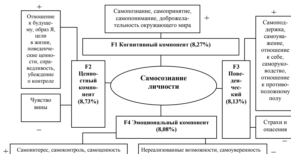
Рис. 1. Структурно-содержательные компоненты самосознания лиц юношеского возраста (выборка «группа норма»)

Общая объяснимая дисперсия составляет 34,12%. В первый фактор F1, объяснительная сила дисперсии которого представлена 10,69%, вошли показатели: материальное положение (0,592), внутренний мир (0,544), самопонимание (0,716), будущее (0,711), чувство вины (0,400), имеющие положительный полюс, познавательные потребности (-0,446) с отрицательным полюсом фактора. Так как большинство характеристик данного фактора представляют когнитивные характеристики самосознания, данный фактор был отнесен к когнитивному компоненту структуры самосознания.