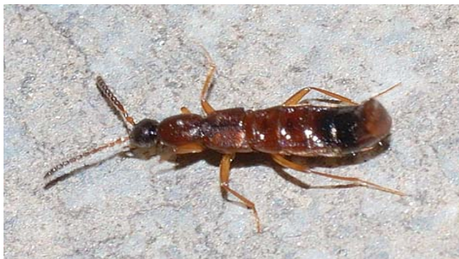
Рис. 1. Drusilla canaliculata F. (фото А.С. Бабенко)

сосново-березовых лесах и на участках черневой тайги [38]. На экспериментальном участке доля X. tricolor была достаточно высока на посадках земляники (26,65%) и в тополевой лесополосе (24,66%), а активность P. decorus была относительно выше в более влажных местообитаниях – в березняках (18,80%) и на посадках смородины (16,30%).