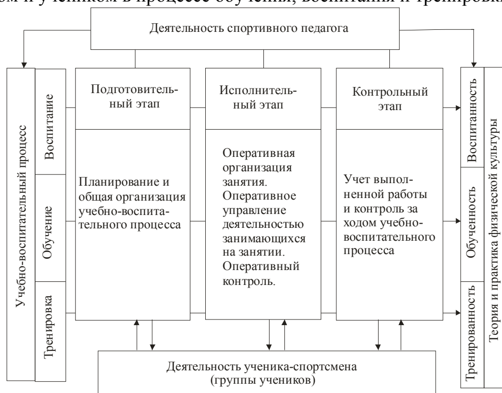
Рис. 1. Схема деятельности спортивного педагога по управлению учебно-тренировочным процессом (по В.М.Корецкому, [3]).

От деятельности спортивного педагога зависит эффективность всего процесса обучения. В целостной деятельности тренера можно выделить несколько групп типичных действий обладающих своей внутренней организацией и направленностью и имеющих специфические состав, строение и функционирование, отражающие взаимодействия между педагогом и учеником в процессе обучения, воспитания и тренировки (рис. 1).