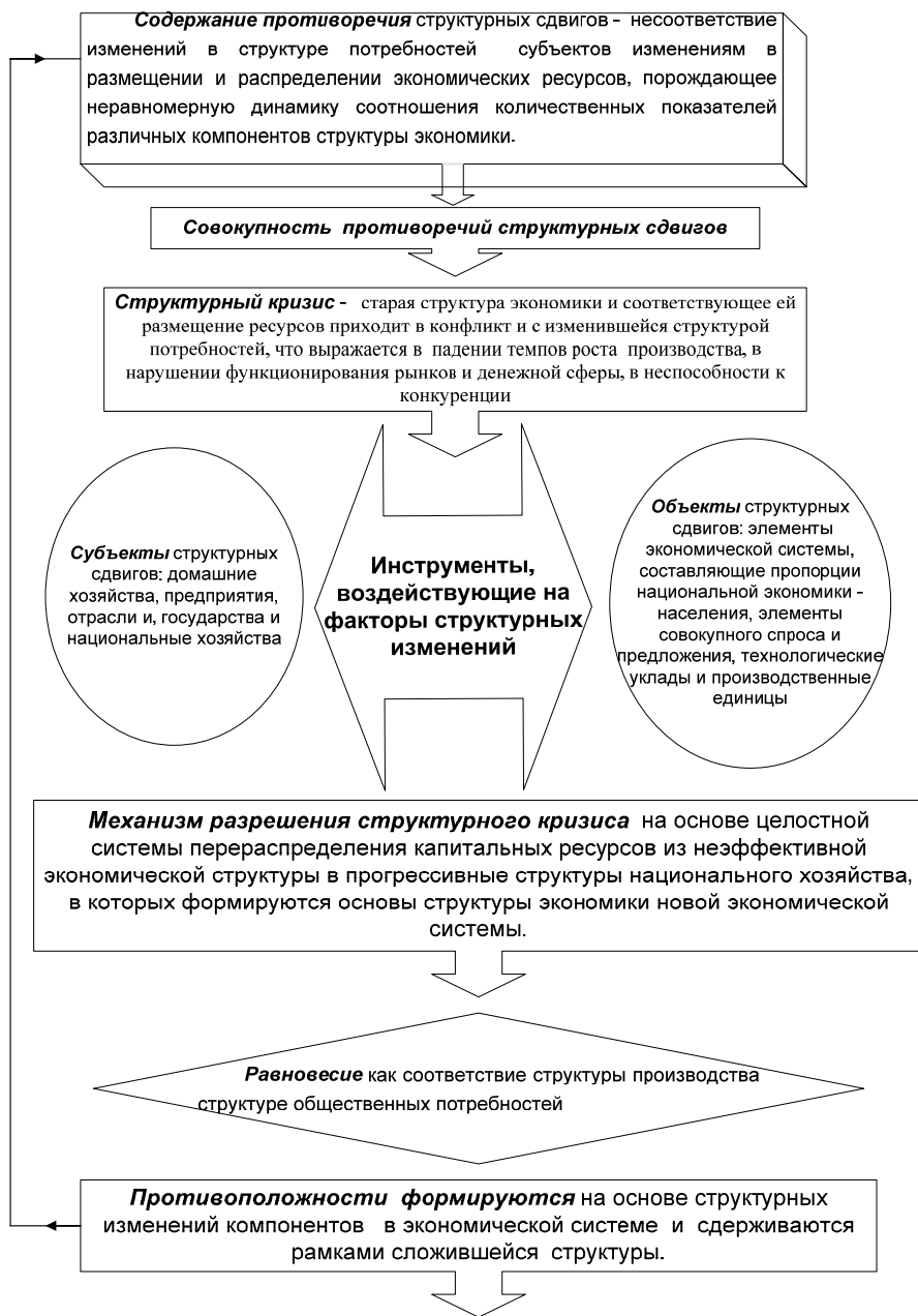
Рисунок 3 – Противоречия, определяющие содержание структурных сдвигов