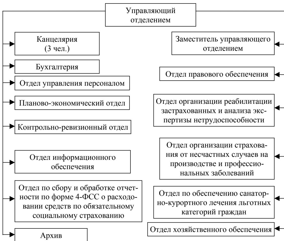
Рисунок 3 — Структура управления региональным отделением Фонда социального страхования РФ

представлена (рис. 3). Мы считаем, что необходимо создать отдел по сбору и обработке отчетности по форме 4-ФСС о расходовании средств по обязательному социальному страхованию; организовать единую централизованную бухгалтерию с распределением обязанностей по начислению и выплате заработной платы, учету материальных активов, ведению банковских операций, выдаче товарно-материальных ценностей (путевки на санаторно-курортное лечение); сделать единый архив для хранения личных (учетных) дел пострадавших от несчастных случаев на производстве и профессиональных заболеваний, личных дел страхователей. Для четкой работы всего регионального отделения фонда социального страхования РФ необходимо на базе действующего отдела делопроизводства и кадров организовать единую канцелярию для обработки всей входящей и исходящей корреспонденции, а вопросы, связанные с кадрами, вывести в самостоятельный отдел — отдел управления персоналом.